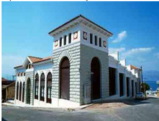
Δημοτική Αγορά -Αίγιο