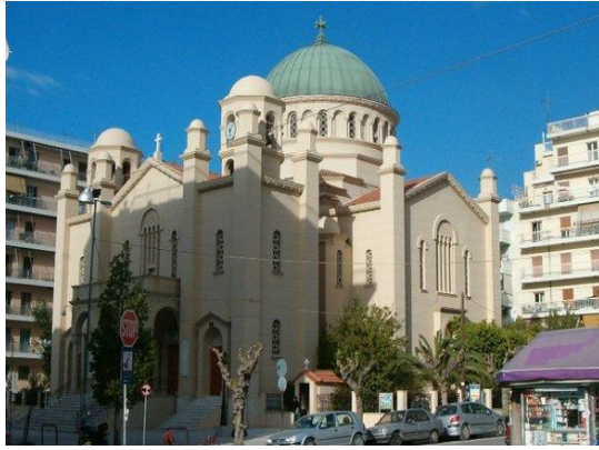
Άγιος Διονύσιος -πάτρα